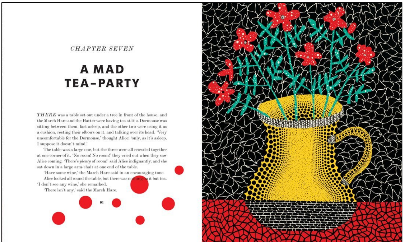
Figure 3b. Pagine tratta da Lewis Carroll's Alice's Adventures in Wonderland . With artwork by Yayoi Kusama, London 2012.

Questa edizione carrolliana – caratterizza da colori vivaci e pervasa da alcuni dei più famosi motivi fantastici dal repertorio di Kusama – non contempla illustrazioni che seguano pedissequamente gli episodi della storia, bensì la accompagna, le fa eco, richiamandone alcuni elementi: Alice stessa compare solo qualche volta, e di conigli o lepri non v'è traccia. Attraverso Alice, la Kusama apre un varco verso il mondo di Alice e verso il suo, quel mondo psichedelico che anima da quasi cinquant'anni la sua fantasia, altrettanto psichedelica. A suggello di questa liaison, spicca la frase che chiude il volume, come una firma: “I, Kusama, am the modern Alice in Wonderland”.