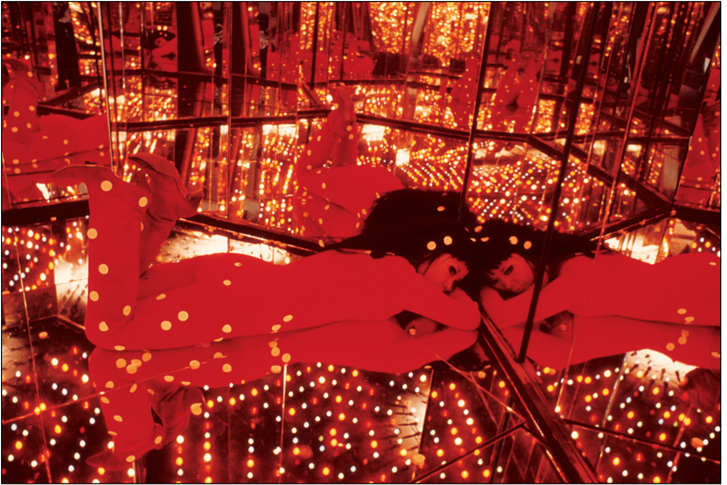
Figure 2. Yayoi Kusama dentro Kusama's Peep Show or Endless Love Show, 1966.

Dunque – come ha notato Katz – il peep show della Kusama, invece di mostrare scene legate al sesso o al nudo, pone l'accento “on an intersubjective tissue of relationality in which the self implies the other, in which requires the other to come to consciousness of itself” (Katz 2017, 83).