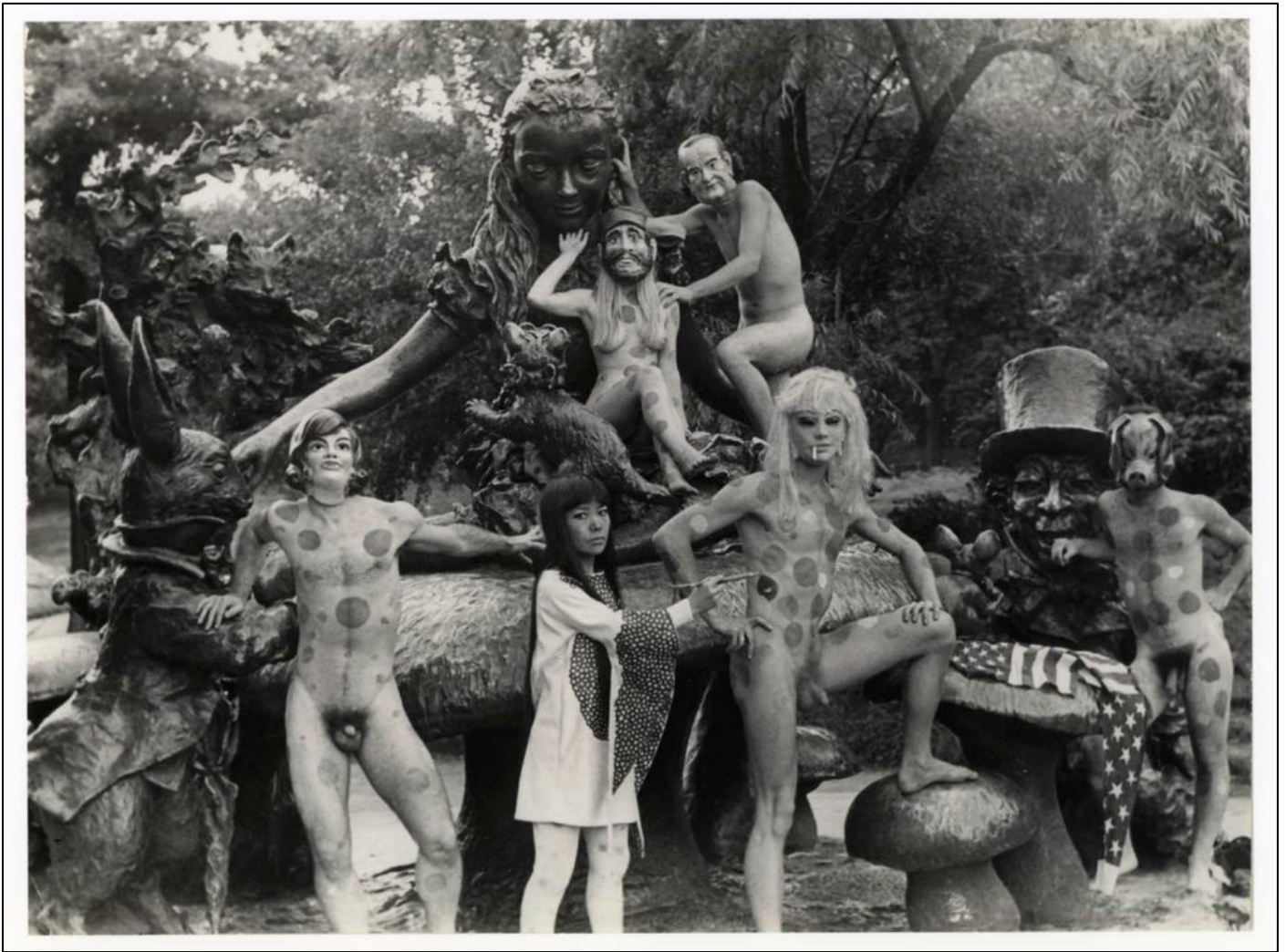
Figure 1. Yayoi Kusama, Alice in Wonderland Happening , Central Park, New York 1968.

“How about taking a trip with me out to Central Park [...] under the magic mushroom of the Alice in Wonderland statue. Alice was the grandmother of the Hippies. When she was low, Alice was the first to take pills to make her high. I, KUSAMA, AM THE MODERN ALICE IN WONDERLAND. Like Alice who went through the looking glass, I, Kusama (I have lived for years in my famous, specially built room entirely covered by mirrors) have opened up a world of fantasy and freedom. You too can join my adventurous dance of life” (Kusama, 2011, 42).